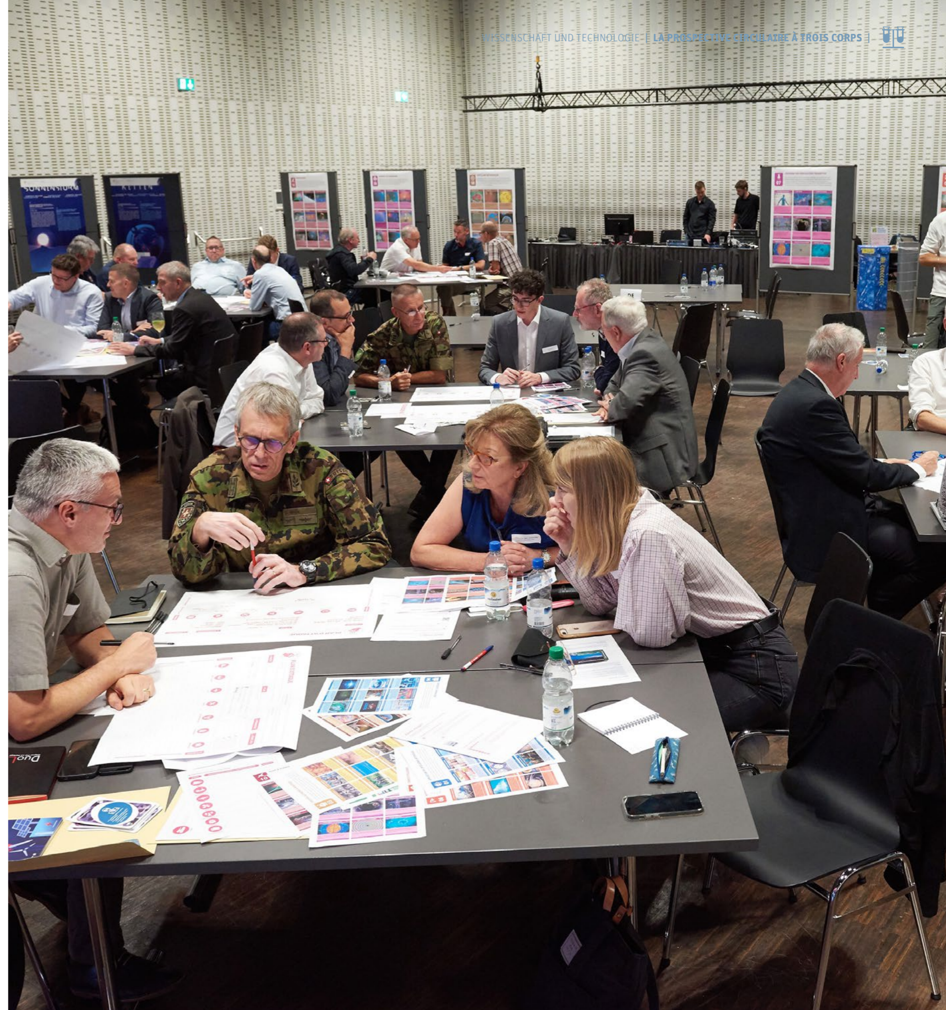
La prospective est avant tout un état d'esprit acceptant de prendre en compte et de discuter différents points de vue pour une même situation.

Se pencher sur de nombreux futurs différents signifie aussi que chaque option doit être comparée aux autres. Dans ce programme de recherche, il s'agit de tirer des enseignements de ces possibilités futures afin d'éviter un risque ou de saisir une opportunité. Cela conduit nécessairement à des actions impliquant des changements; aventures que l'être humain est par nature peu enclin à entreprendre, du moins au début.